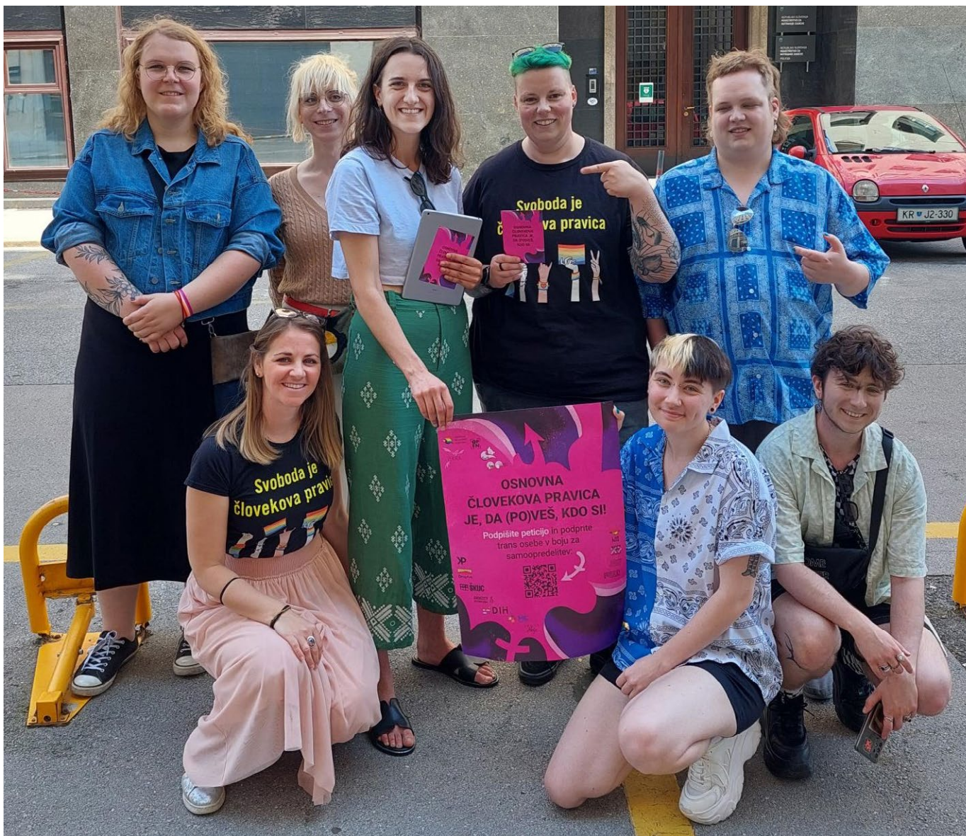
Amnesty International Slovenije, Zavod TransAkcija in pripadnice_ki transspolne skupnosti na novinarski konferenci ob začetku peticije za pravno priznanje spola na podlagi samoopredelitve v Sloveniji. Dan parade ponosa 2023, Ljubljana.