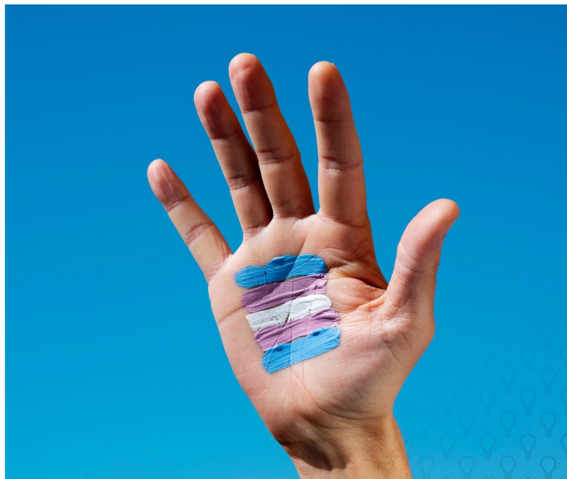
Trans zastava ponosa, katere barve predstavljajo moške (modra), ženske (roza) in nebinarne osebe in spolno nevtralne identitete (bela).