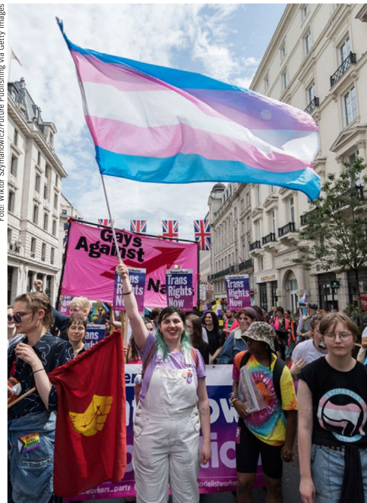
Trans parada ponosa v Londonu, julija 2023.