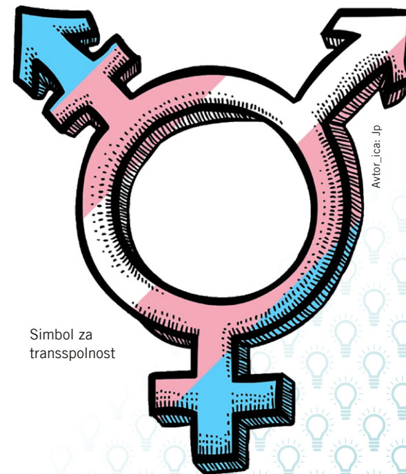
Simbol za transspolnost

Transspolne osebe so vseh starosti, etničnih pripadnosti, izgledov, spolnih usmerjenosti, razredov itd. in obstajajo po vsem po svetu. V Sloveniji se ocenjuje, da jih živi približno 12.000. Dejstvo, da se v zadnjih desetletjih več govori o transspolnosti, ne pomeni, da pred tem niso obstajale, le (še) bolj nevidne so bile.